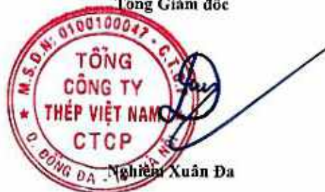
Nghiêm Xuân Đa