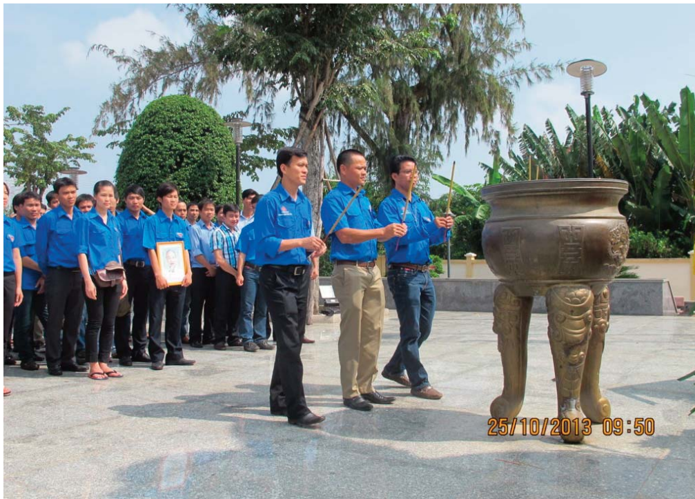
Đoàn viên Thanh niên Công ty Thép miền Nam về nguồn để ôn cố tri tân

thực đáp ứng nhu cầu bức thiết của công nhân. Do vậy, mọi hoạt động phải đưa về cơ sở; xây dựng phong trào phải lấy người lao động làm chủ thể; sức mạnh của công đoàn nằm trong việc làm cho đoàn viên thấy được lợi ích khi gia nhập, bàn bạc, tham gia hoạt động, gắn bó với tổ chức công đoàn.