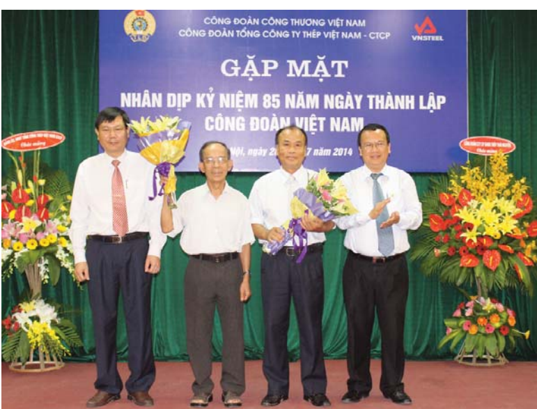
BCH CD VNSTEEL đương nhiệm tặng hoa tri ân lãnh đạo Công đoàn tiền nhiệm