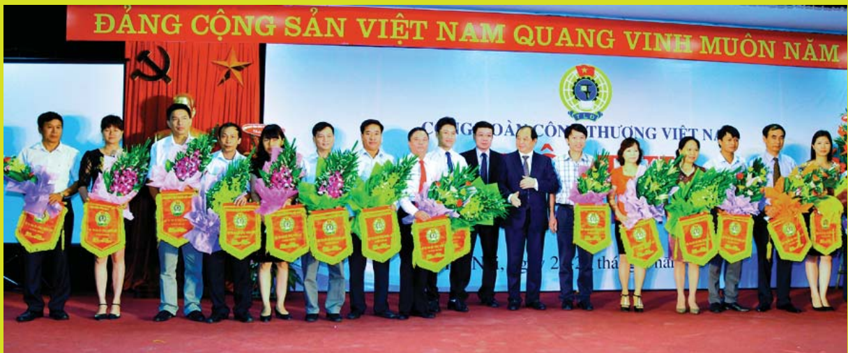
Đại biểu các đoàn nhận hoa tặng của Ban tổ chức Hội thi