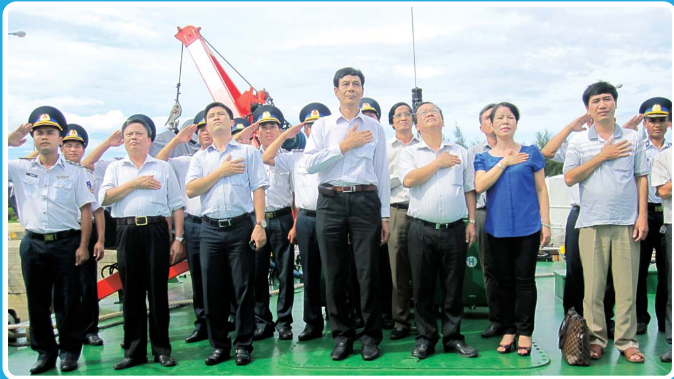
Lễ chào cờ trên tàu với cảnh sát biển