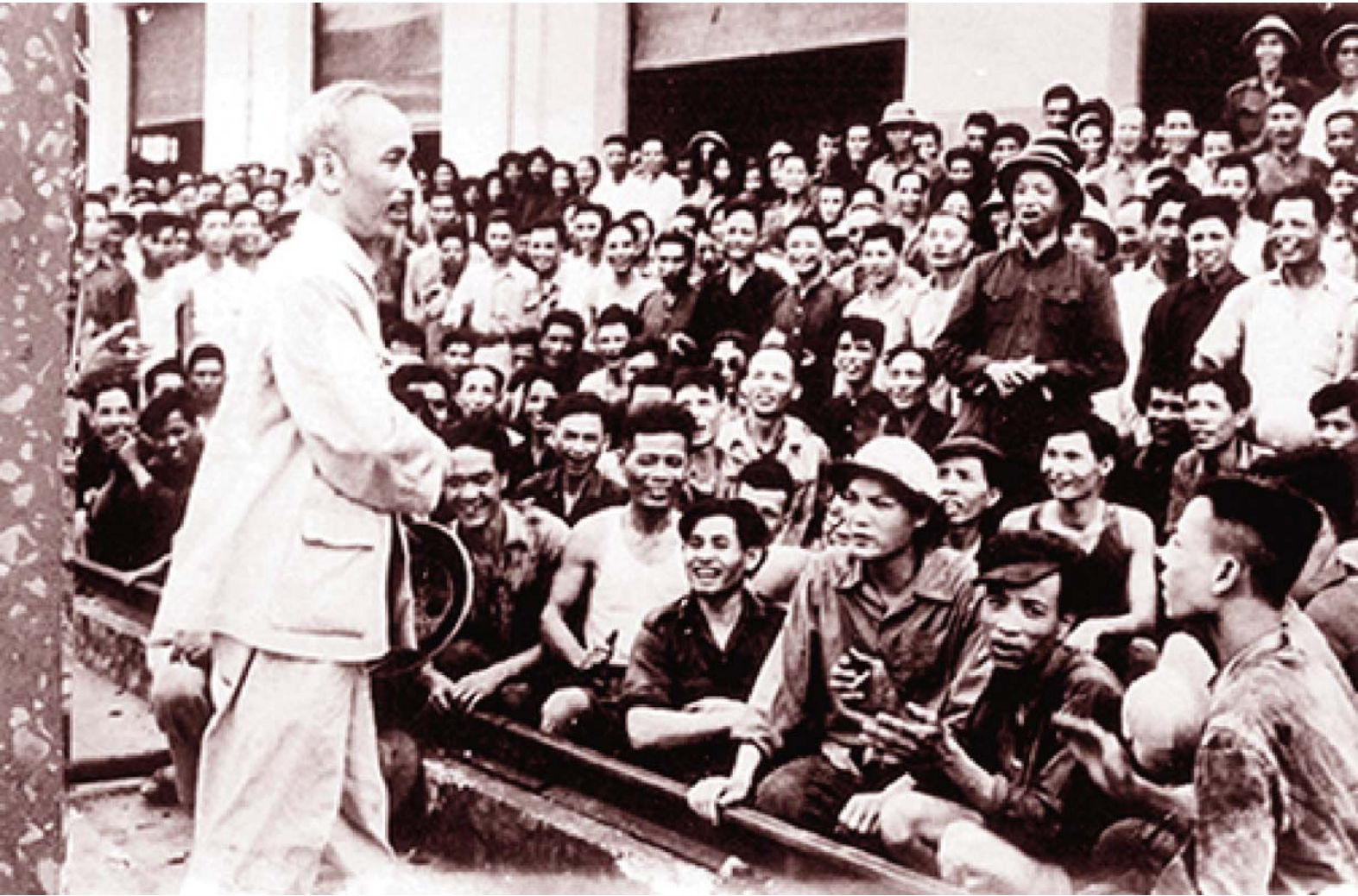
Bác Hồ với công nhân Việt Nam