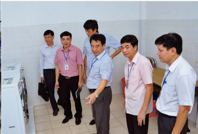
Các đại biểu đi thăm quan công trình nhà tắm - giặt - xông hơi liên hoàn tại Nhà máy Cán thép Lưu Xá

Ngày 24/7/2014, nhân kỷ niệm 85 năm ngày thành lập Công đoàn Việt Nam, Công đoàn Công ty CP Gang Thép Thái Nguyên tổ chức khánh thành và gắn biển công trình chào mừng gồm 2 nhà ăn ca tự chọn tại Mỏ sắt Trại Cau và Công ty CP Cán thép Thái Trung; công trình nhà tắm - giặt - xông hơi liên hoàn tại Nhà máy Cán thép Lưu Xá.