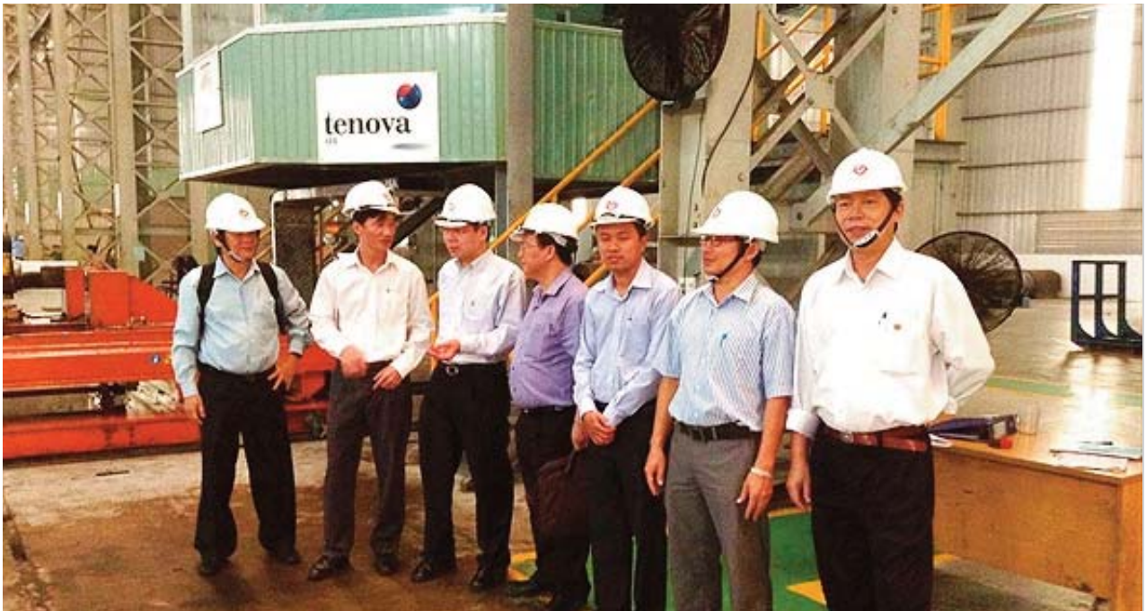
Công đoàn khảo sát tại Công ty CP Thép Tấm lá Thống Nhất

Cũng tại Hội nghị, Công đoàn TCT đã báo cáo kết quả cuộc vận động ủng hộ Biển Đảo của đoàn viên Công đoàn và NLĐ TCT với tổng số tiền thu được gần 1 tỷ đồng sẽ được sử dụng để hỗ trợ ngư dân, lực lượng cảnh sát biển, kiểm ngư và tham gia chương trình “Nghĩa tình Trường Sa, Hoàng Sa” do TLĐLĐVN phát động. Công đoàn TCT trân trọng cảm ơn nghĩa cử cao đẹp của NLĐ trong toàn hệ thống TCT, đồng thời biểu dương các đơn vị đã tích cực tham gia, nổi bật là Công ty Thép Tây Đô, Công ty CP Trúc Thôn, Công ty CP Gang Thép Thái Nguyên,