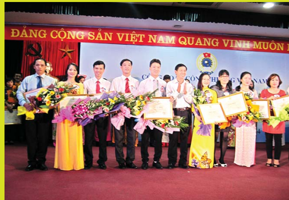
Các thí sinh nhận giải ba của Hội thi