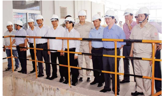
Bộ trưởng Bộ Công Thương đến thăm và làm việc tại Nhà máy Gang thép Lào Cai