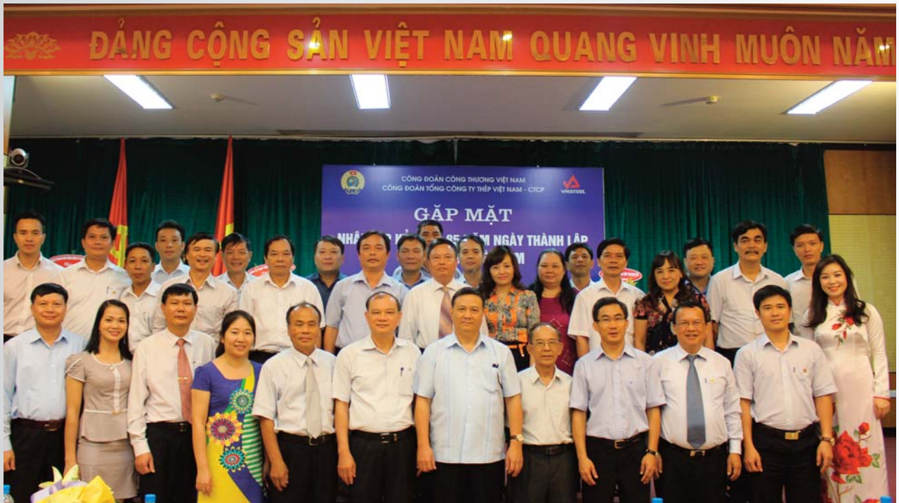
Các đại biểu dự buổi gặp mặt