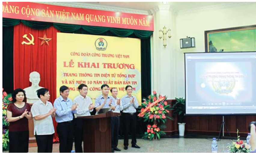
Bấm nút khai trương trang congdoancongthuong.org.vn

NHÌN LẠI MỘT NĂM SAU ĐẠI HỘI II CÔNG ĐOÀN CÔNG THƯƠNG VIỆT NAM (CĐCT), HOẠT ĐỘNG CỦA TỔ CHỨC CÔNG ĐOÀN NGÀNH CÔNG THƯƠNG ĐÃ CÓ NHIỀU KHỞI SẮC, ĐƯỢC TỔNG LĐLĐ VIỆT NAM ĐÁNH GIÁ CAO. 7 THÁNG ĐẦU NĂM NAY, CĐCT ĐÃ CÓ NHIỀU HOẠT ĐỘNG NHÂN KỶ NIỆM 85 NĂM NGÀY THÀNH LẬP CÔNG ĐOÀN VIỆT NAM.