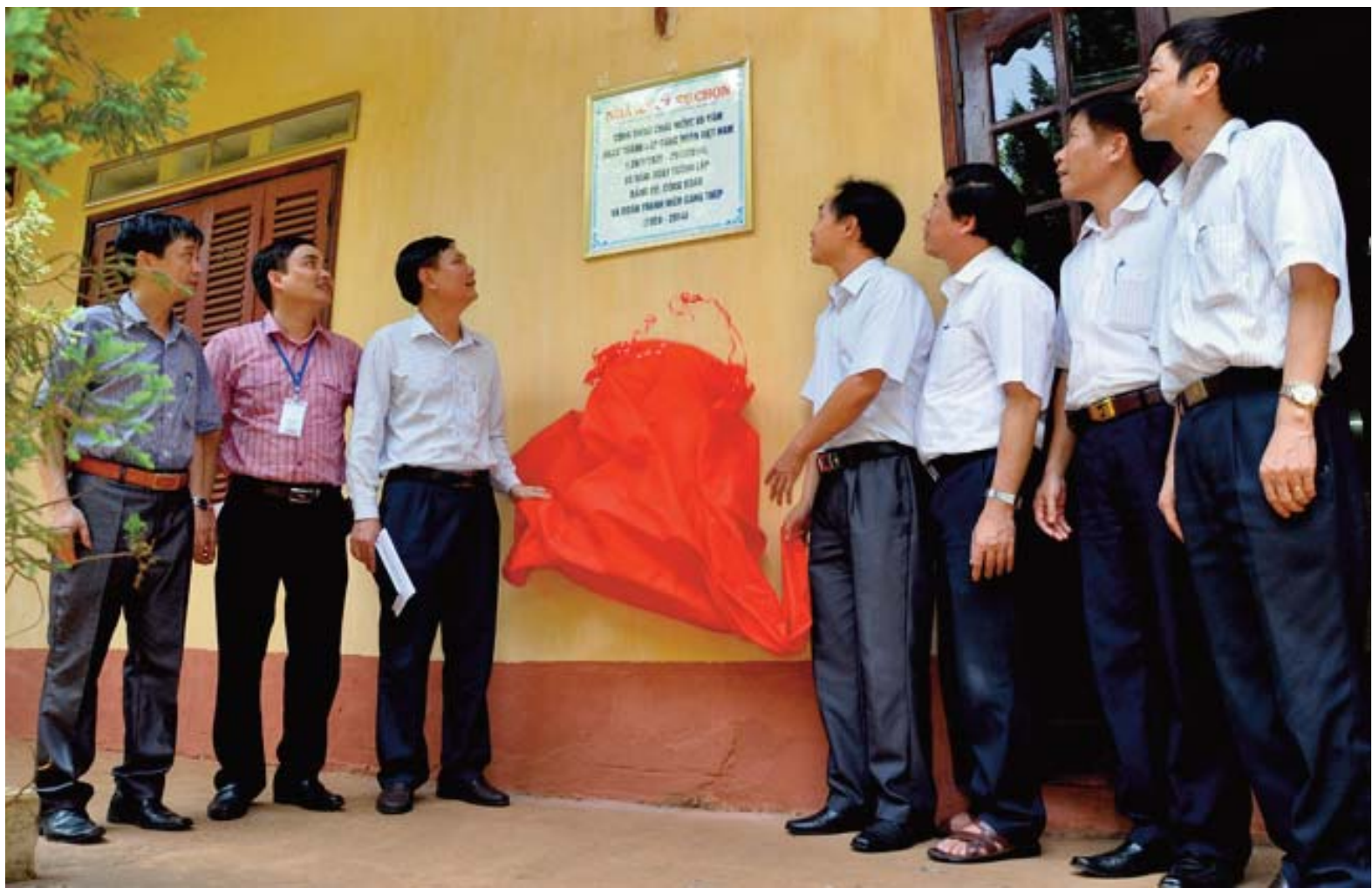
Cắt băng khánh thành và gắn biển chào mừng Nhà ăn ca tự chọn Mỏ sắt Trại Cau