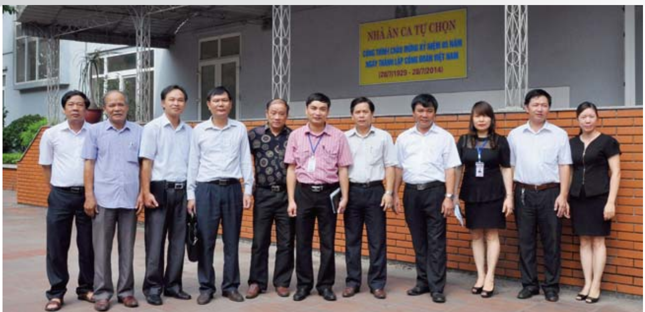
Gắn biển công trình Nhà ăn tự chọn tại Công ty CP Gang Thép Thái Trung