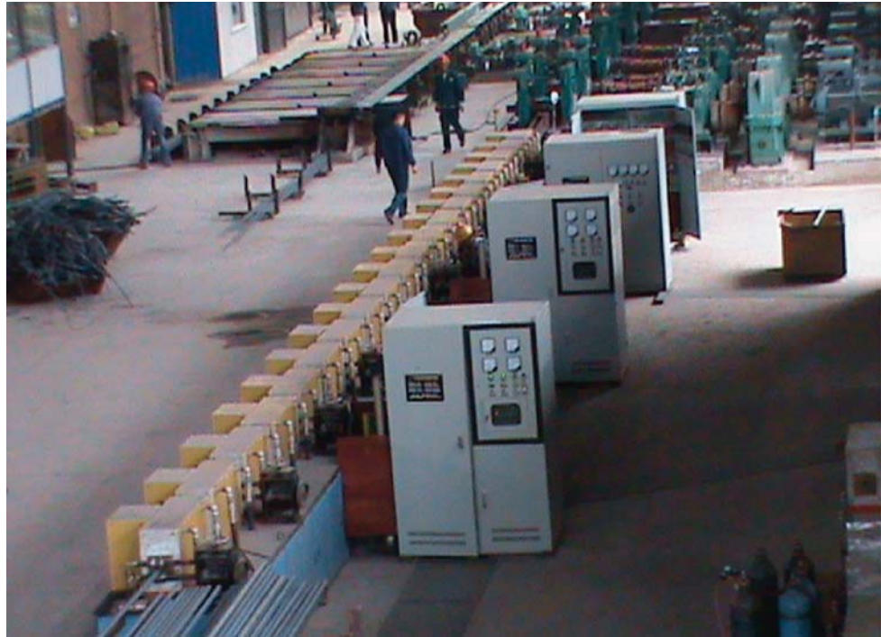
Dây chuyền cán phôi nóng bằng lò gia nhiệt

Từ sau khi cổ phần hoá năm 2008, việc đầu tư được quan tâm