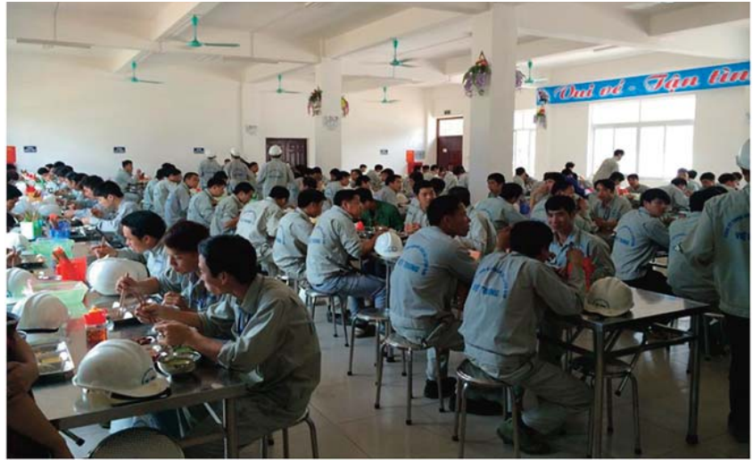
Bữa ăn mát mẻ, ngon miệng khiến người lao động VTM gắn bó với nhau hơn

Đáp ứng nhu cầu chính đáng của tập thể người lao động đang làm việc trên công trường Nhà máy, từ trước đó một thời gian, Ban Chấp hành Công đoàn Nhà máy đã đề xuất với Tổng giám đốc Công ty cử một đoàn tham quan học hỏi mô hình bếp ăn tự chọn của một số đơn vị tại Công ty CP Gang Thép Thái Nguyên. Được sự thống nhất cao, Lãnh đạo Nhà máy đã chỉ đạo xây dựng phương án tổ chức mô hình nhà ăn ca tự chọn “từ A đến Z”, từ việc mua sắm trang thiết bị nhà ăn, cải tạo các khu vực liên