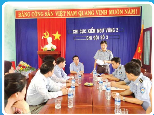
Trao quà cho lực lượng kiểm ngư