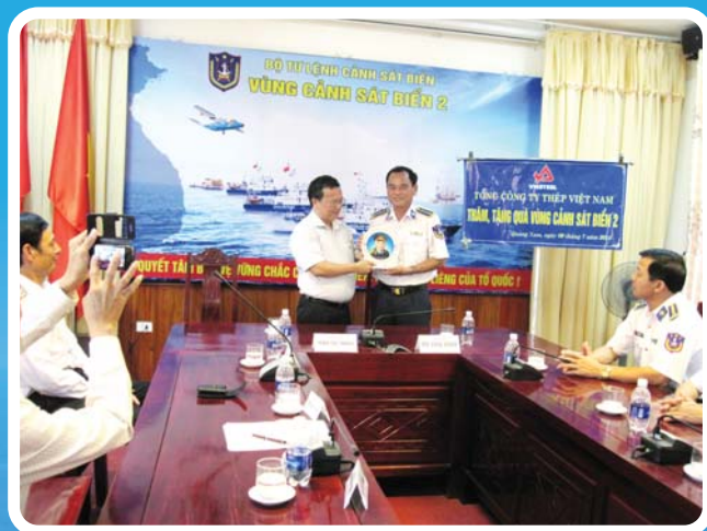
Trao quà cho cảnh sát biển