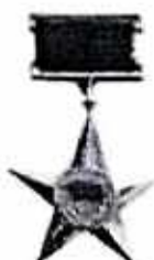
Anh hùng LLVT Nhân dân