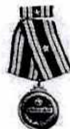
Huân chương Độc lập Hạng Ba