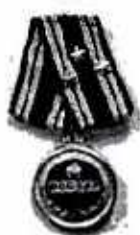
Huân chương Độc lập Hạng Nhất